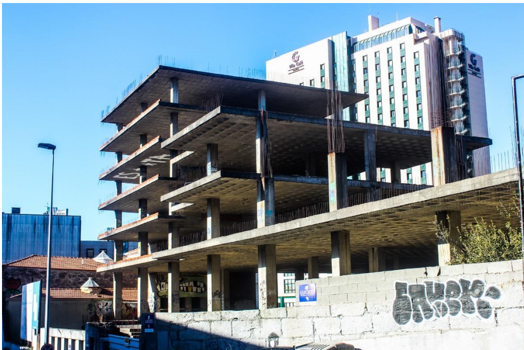
Edifício onde Gisberta morreu, no Porto.

É evidente que foi uma escrita penosa, em muitos aspetos, mas também foi fruto de muito trabalho e de um horário de escrita. Não é só uma coisa de inspiração e de “hoje estou imerso nesta história”. Não, é um trabalho continuado.